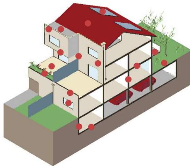
Figura 4. Esquema de un edificio (Patorreb) (Freitas et al. 2007)