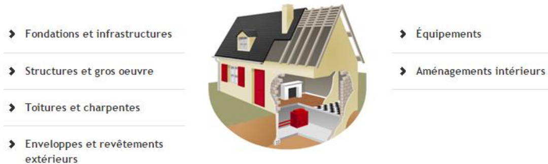
Figura 1. Fiches pathologie du bâtiment (AQC, 2014)

La empresa portuguesa OZ - Diagnóstico, Investigación y Control de Calidad de Estructuras y Fundaciones, Lda. desarrolló un servicio de pre-diagnóstico de anomalías en edificios, llamado Construductor (Ribeiro e Córias, 2003). El servicio surge como un sistema que brinda el diagnóstico on-line , cuyo principal objetivo es auxiliar en la corrección de anomalías en edificios, proporcionando explicaciones básicas sobre las causas probables, haciendo un diagnóstico preliminar y definiendo medidas correctivas. El servicio ofrece un pre-diagnóstico sobre la base de un formulario on-line (ver figura 2). Posterior al sometimiento, las respuestas del entrevistado son evaluadas por especialistas en la patología y rehabilitación de la construcción, que completan un informe on-line con la identificación de la anomalía, especificando las posibles causas y acciones correctivas.