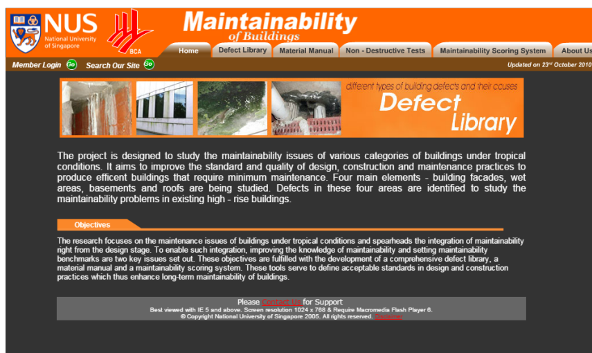
Figura 6. Mantenimiento del sitio WEB (Chew, 2010)