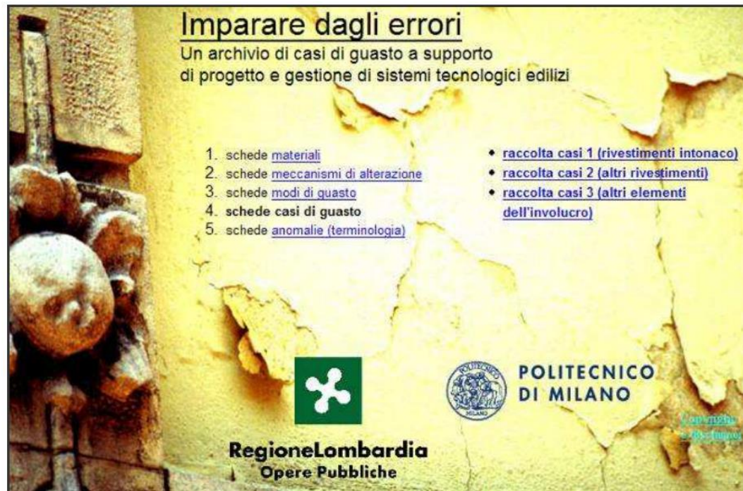
Figura 3. "Aprender con los errores" (BEGroup, 2004)

El Grupo de Estudios de Patología de la Construcción creó un sitio web dedicado a la divulgación de un catálogo de fichas de patología (Freitas et al. 2007). Desde 2004, los usuarios registrados tienen acceso al campo de Patología, donde el esquema de un edificio presenta las fichas de patología de acuerdo con el elemento constructivo (ver figura 4). Al seleccionar el respectivo elemento, es presentada la lista de fichas de patología asociadas. A semejanza de los casos anteriores, estas fichas están estructuradas de la siguiente forma: i) Identificación de la patología; ii) Descripción de la patología; iii) Sondeos y medidas; iv) Causas de la patología; e v) Soluciones posibles de reparación.