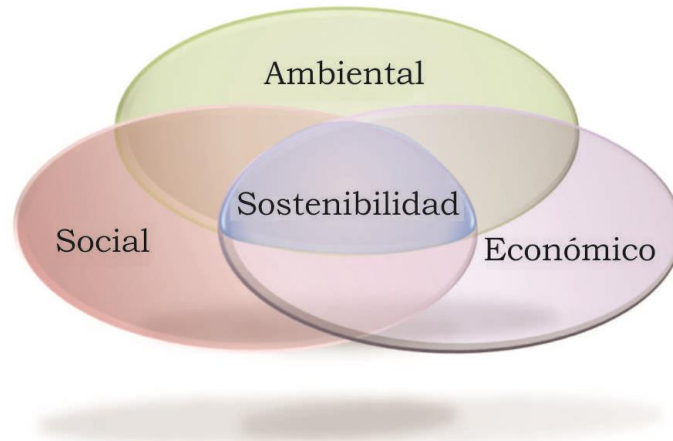
Figura 1. Configuración macro de sostenibilidad vinculada a tres campos vitales: social, económico y ambiental (adaptado de Concrete Centre , 2007)

En general, se observa que los recursos naturales finitos del mundo están siendo utilizados y desechados a un ritmo que el mundo no puede permitirse. Por otra parte, las emisiones causadas por el consumo de estos recursos están produciendo contaminación ambiental y la degradación está conduciendo a un cambio climático global. El impacto ambiental causado por los seres humanos ha sido repetidamente alertado por organizaciones 3 repartidas por todo el planeta. Grandes movimientos para divulgar la degradación del medio ambiente están siendo promovidos en Brasil 4 y en el mundo, aún así, el concepto de sostenibilidad todavía encuentra resistencias en algunos sectores de la sociedad, incluyendo el de la construcción.