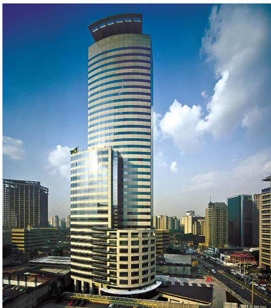
Figura 2. Perspectiva arquitectónica del edificio e-Tower en São Paulo, Brasil ( Concrete International , 2003)

En este edificio se hormigonaron cinco columnas pasando por los cuatro subsuelos, la planta baja y los 4 primeros pisos, con un hormigón de f_{ck} = 80\text{MPa} 7 a los 28 días de edad. En la Figura 2 se puede observar la perspectiva arquitectónica del edificio e-Tower ( Concrete International , 2003).