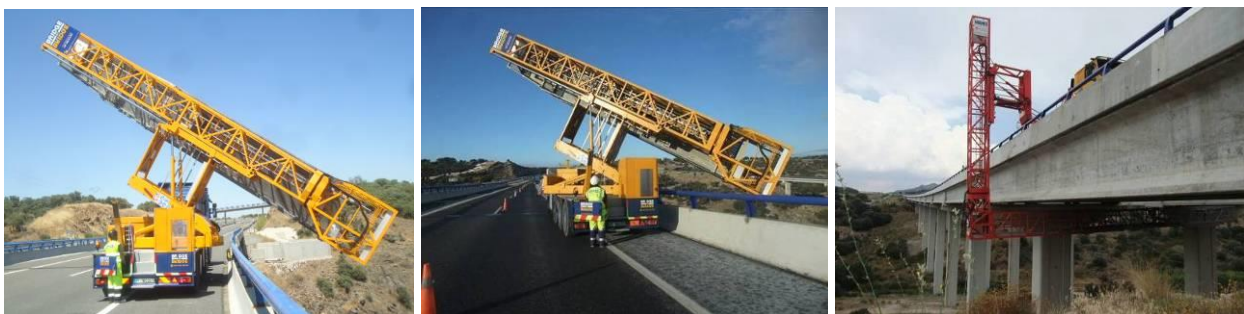
Figura 3. Maniobras de despliegue de pasarelas standard de inspección de puentes para examen de la cara inferior del tablero.

Esto plantea un problema para la inspección, tanto de los anclajes inferiores como del tablero en sí mismo, pues los propios tirantes inclinados hacen imposible la maniobra de despliegue de equipos standard de inspección de puentes (Figura 3)