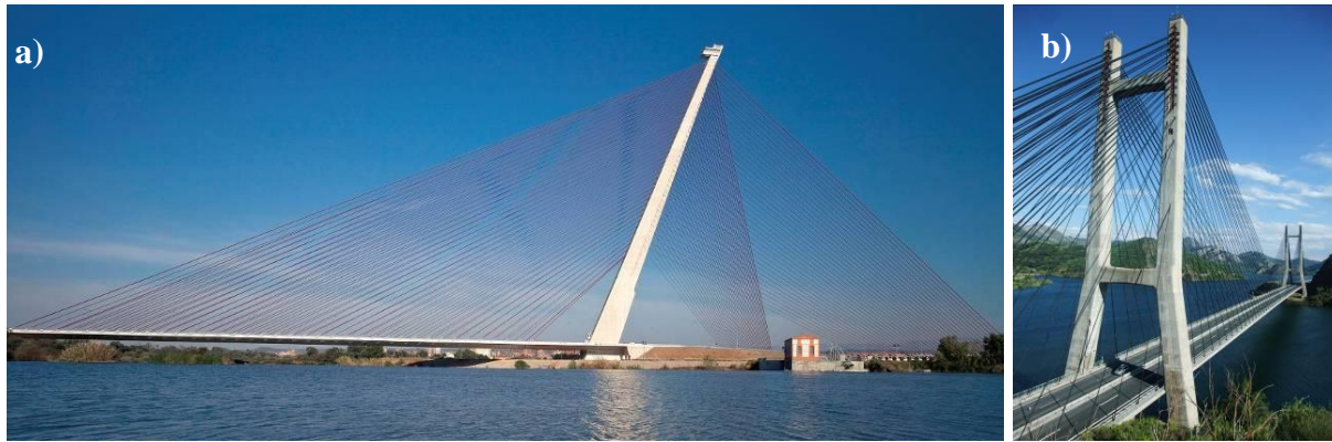
Figura 1. Puentes atirantados: a) sobre el río Tajo en Talavera de la Reina (Toledo, España), con un pilono de 192 m de altura (Sánchez de León et al., 2012); b) sobre el embalse de Barrios de Luna (León, España) con pilonos de 90 m sobre el tablero (Manterola et al., 1984).