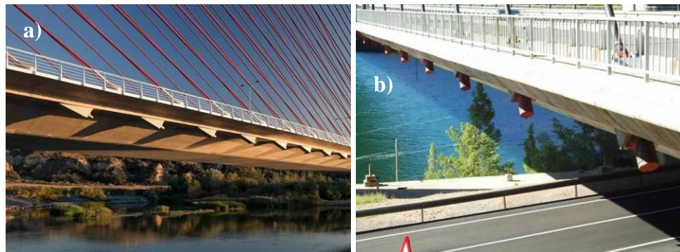
Figura 2. Anclajes de tirantes bajo el tablero en los puentes de: a) Talavera de la Reina (Sánchez de León et al., 2012); b) Carlos Fernández Casado (Manterola et al., 1984).

Esto plantea un problema para la inspección, tanto de los anclajes inferiores como del tablero en sí mismo, pues los propios tirantes inclinados hacen imposible la maniobra de despliegue de equipos standard de inspección de puentes (Figura 3)