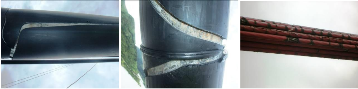
Figura 8. Agrietamientos en vainas de protección de tirantes antiguos correspondientes a dos tecnologías diferentes.

En (Tabatabai, 2005) se comenta que se habían detectado problemas de agrietamiento de vainas en hasta un 14% de los puentes atirantados de EE.UU. incluidos en el estudio. Problemas del mismo tipo se han presentado en los puentes de Zárate-Brazo Largo en Argentina o el puente Luling en Louisiana así como fisuraciones en la lechada de cemento con que se inyectó la vaina (Ladret, 2013) (Saul et al, 1998, 2002 y 2007) (Tabatabai, 2005).