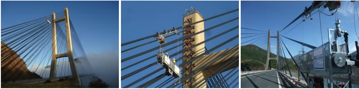
Figura 6. Equipo de inspección de tirantes del Viaducto Carlos Fernández Casado.

El uso de este tipo de canastillas facilita en gran medida una adecuada inspección de los tirantes pero implica considerables costes, de inversión, de mantenimiento y de uso del equipo, al exigir la intervención de especialistas en altura para su montaje en los diferentes planos de atirantamiento del viaducto.