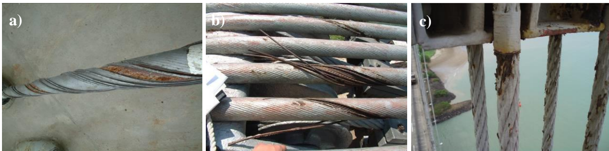
Figura 9. a) Rotura de alambres en un tirante de cable cerrado; b) Rotura de alambres por corrosión en el puente de Amposta; c) Corrosión en péndolas del puente de las Américas.

Cabe asimismo comentar la presencia de problemas en otras tipologías de tirantes (Gimsing et al., 2012) (Saul et al., 1998, 2002 y 2007) (Tabatabai, 2005), tales como los problemas de roturas de alambres en cables cerrados de puentes (Figura 9 a) como el de Köhlbrand, el de Maracaibo o el Norderelbe. En una línea similar y aunque no se trate de puentes atirantados, también cabe hablar de los problemas de corrosión hallados en las péndolas del puente de las Américas (Ladret et al., 2011) (Ladret, 2013) o en los cables principales y péndolas del puente de Amposta (Figura 9 b y c) (del Pozo et al., 2006).