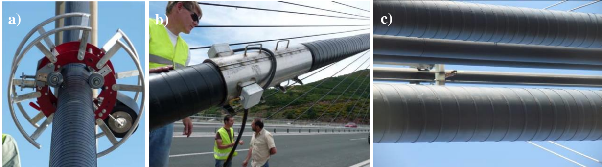
Figura 10. Reparación de vainas mediante encintado con banda elastomérica: a) Máquina de encintado; b) Tratamiento térmico de vulcanizado in situ; c) Aspecto de dos tirantes encintados.

Entre esas pocas técnicas que sí parecen suficientemente probadas está la de la reparación de vainas agrietadas mediante encintado helicoidal con una cinta elastomérica tricapa de un material polimérico de polietileno clorosulfonado, reforzada con fibras, que es posteriormente vulcanizada in-situ mediante tratamiento térmico con mantas eléctricas (Figura 10) 1 . El sistema se ha venido utilizando en puentes atirantados o colgantes desde 1992, al parecer con buenos resultados.