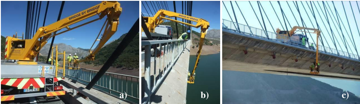
Figura 4. Utilización de un equipo de brazo articulado con canastilla en inspección de un puente atirantado: a) y b) Maniobras de despliegue; c) inspección de un anclaje.

mantenimiento en las que vayan a utilizarse. Por otro lado, este equipo resulta muy limitado si lo que se pretende es inspeccionar la cara inferior del tablero, puesto que la penetración en horizontal bajo el mismo no es comparable con la alcanzada con una pasarela como las de la Figura 3. De esta forma, tanto la inspección del tablero por su cara inferior como la de los anclajes de los tirantes en el mismo, se transforma en una tarea posible, pero con un coste muy superior al que hubiera podido tener de haber sido concebido el puente pensando en ello.