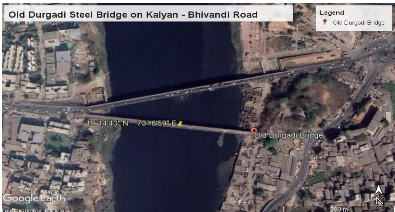
Figura 1. Mapa del Puente en Google.

Debido a la fuerte contaminación en el río Ulhas, al agua, la humedad y debido a la cercanía de la orilla del mar, el estado del puente está muy deteriorado. Hay una fuerte corrosión de las piezas de acero utilizadas en la estructura. La estructura debe haber sido diseñada para el agua normal del río en 1914. Sin embargo, se ve que el color del agua del río es negruzco, lo que puede deberse a la mezcla de las aguas residuales de las áreas urbanas circundantes y los desechos industriales. El agua del río contiene productos químicos orgánicos e inorgánicos además de varios gases como H 2 S, CO 2 , CH 4 y NH 3 , etc., que se forman debido a la descomposición de las aguas residuales. Esto conduce a un deterioro más rápido de la estructura de acero y el concreto.