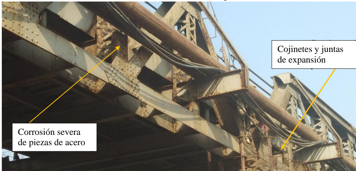
Figura 2. Foto del puente que muestra la ubicación de la junta de rodamiento y expansión

Mapeo de daños. Se necesitarán tipos especiales de cámaras y buzos certificados debido a la turbidez debida a la contaminación. Implicará la videografía subacuática y la toma de fotografías y detalles de la revisión, envío de éstas en copias digitales y un informe del estado de la revisión subacuática. El número total de muelles a ser revisados en el puente será de 9.