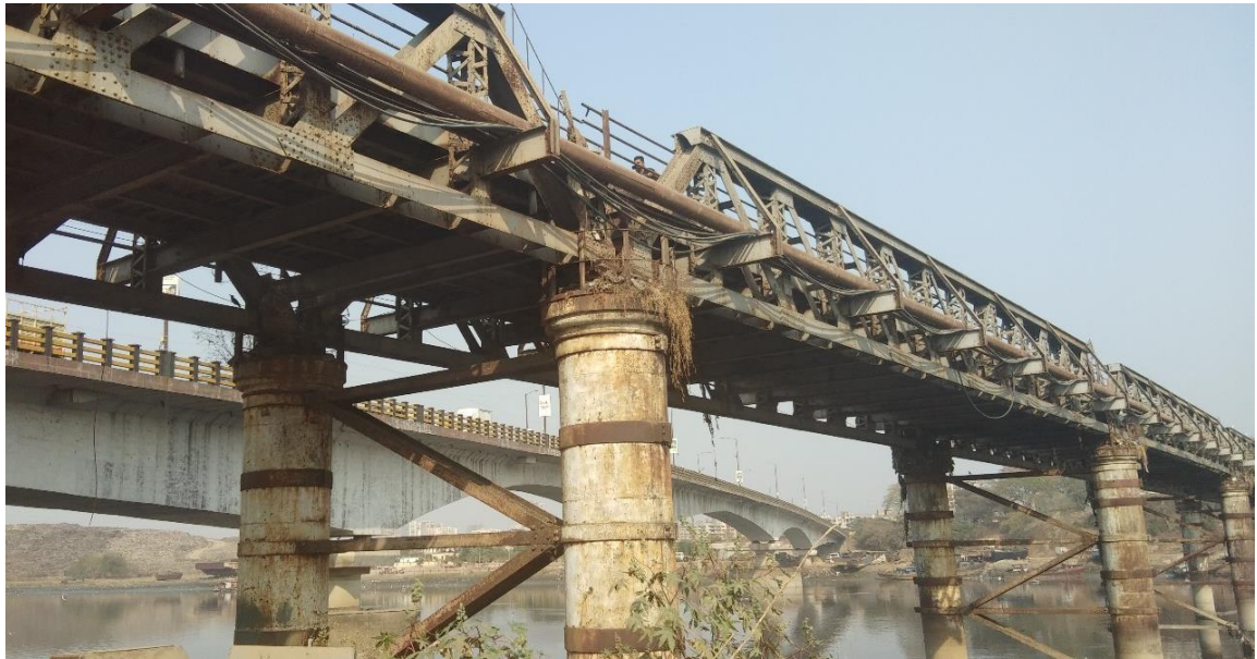
Figura 3. Foto del puente que muestra la estructura tipo Warren Truss.

de elementos reparados o reemplazados y elementos incidentales mediante soldadura o atornillado de alta resistencia a la tracción; y preparando superficies dañadas o dejadas al descubierto por el trabajo y aplicando una capa de pintura.