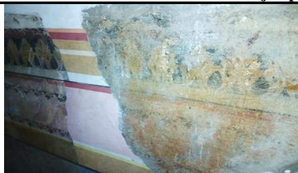
Tabla 1. Ejemplo de restauración objetiva

En la pintura mural, las áreas faltantes del fresco original fueron rellenadas solo con las líneas horizontales sin el resto de los ornamentos. A cierta distancia el ojo fusiona el faltante y desaparece visualmente, pero de cerca el trazo de la reintegración es obvio diferenciándolo del original. Se restituye la lectura estética sin caer en la falsificación y respetando la instancia histórica de la pérdida.